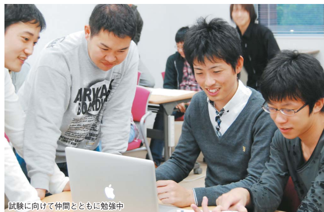
試験に向けて仲間とともに勉強中

勉強してよかったことは、自分の成果を褒めて頂けることです。先生方は勉強するプロセスも、結果を残したことも褒めてくれます。単純かもしれませんが、認めてもらえたようで嬉しいです。