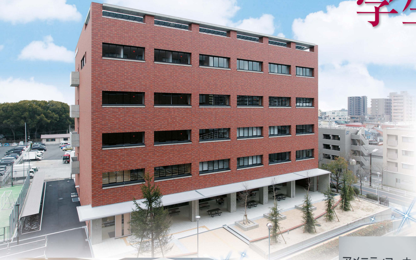
アメニティコーナー Amenity Corner

新たに学生支援推進センター(S-Platz)や資格センターがオープン。キャリアセンターもパワーアップして、学生のキャンパスライフ、将来への進路を力強くサポートいたします。また、ゆったりとくつろげる学生ラウンジや、パソコンを備えたアメニティスペースなど施設もさらに充実しました。