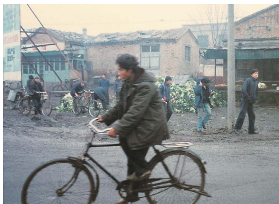
天津市郊外で見られた市民生活。野菜が路上に野積みされている。(1986年撮影)

この問題は、決して我々日本人にとっても対岸の火事と見ていてはならない。なぜなら、いまでは毎年春先になると、中国から黄砂が大量に飛来してくる。これは、国土の砂漠化によるもので、日本人にとって中国の環境問題は決して他人ごとではない。日本人のためにも、中国の緑化推進に協力しなければ、今後も黄砂に悩み続けなければならない。 写真を見てもわかるように、中国の80年代は、北京でも走っている車は少なく、排気ガスなど無縁であった。まさに素朴でのどかな時代であった。ただ、河川の汚染とゴミの不法投棄など、モラルに欠けるところは今と同じで、河川の汚染は当