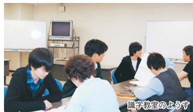
識字教室のようす 現在は、週に1回、1時間程度で大学や大学院の教室を借りて行っています。4、5名の方が通われており、個人のペースで進められるようにマンツーマンで対応しています。ボランティアはボラセンの部員がメインですが、私の友達も参加してくれています。