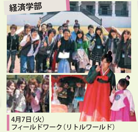
4月7日(火) フィールドワーク(リトルワールド)

本学では毎年新入生オリエンテーションを開催しています。2009年度も、ガイダンスに加え、フィールドワークや合宿を実施しました。このプログラムを通じて、友人や教員、ティーチングアシスタントの先輩らとの交流を深めます。大学生活に早く慣れ、充実した学生生活を送られることを期待しております。