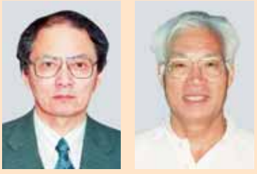
酒井 凌三 教授