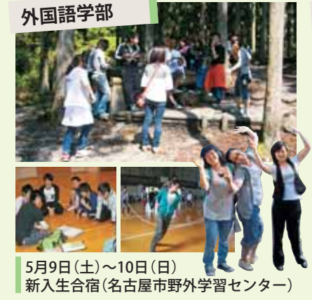
5月9日(土)~10日(日) 新入生合宿(名古屋市野外学習センター)