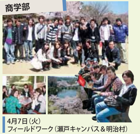
4月7日(火) フィールドワーク(瀬戸キャンパス&明治村)