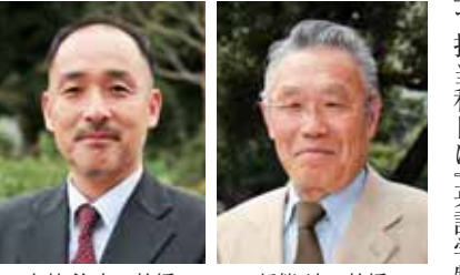
赤楚 治之 教授

教育力の向上が求められる今、熱意あふれる新熊学部長、赤楚研究科長の活躍で、本学のさらなる躍進が期待されます。