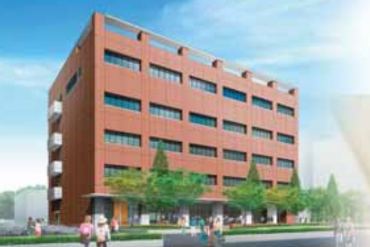
創立45周年記念事業 学生アメニティ棟建設 (2010年2月完成予定)