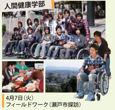
4月7日(火) フィールドワーク(瀬戸市探訪)