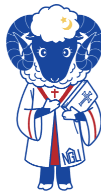
名古屋学院大学 オリジナルキャラクター メイン

LINE ID:@aichi_soudan 受付時間:月曜~土曜20時~24時、日曜20時~翌月曜8時