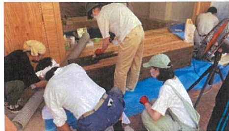
▲8月2日(火) 学生を中心に、みんなの縁側「mochiyori」の家具・建具・壁面を塗装している様子