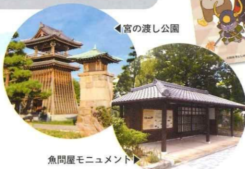
魚問屋モニュメント

謎解きは「初級編」「上級編」の2種類。あつたの町に散らばるヒントをもとに謎を解いて、景品をゲットしよう!