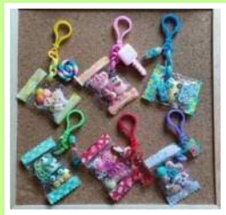
シャカシャカキャンディーバッグ