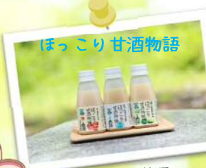
ほっこり甘酒物語