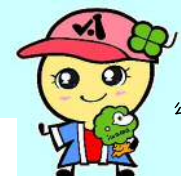
公園キャラクター