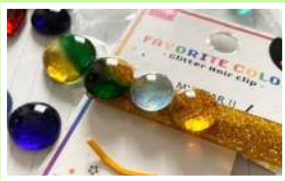
ガラスアクセサリー