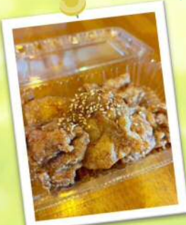
CAFE de OSU