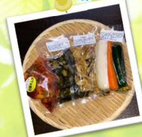
漬物工房かりっ子