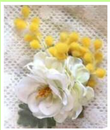
アーティフィシャルフラワーの コサージュ作りと インテリア雑貨