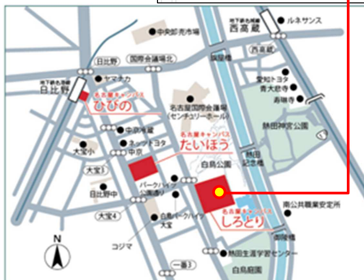
会場周辺案内図（名古屋学院大学ホームページより）

日本都市学会会員以外の方でも参加できます。 参加費無料。申し込みは不要です。直接、会場へ お越しください。